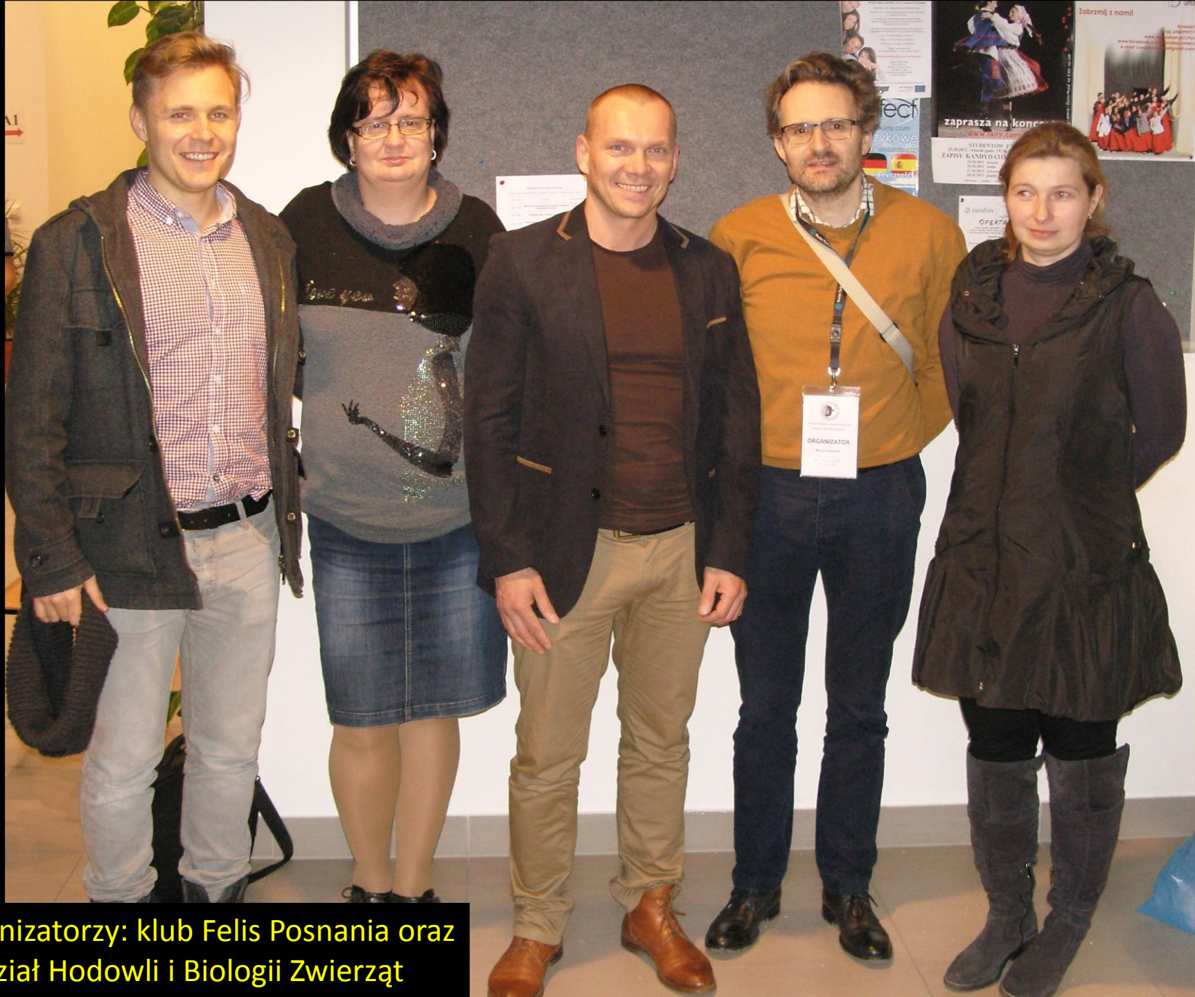
Organizatorzy: klub Felis Posnania oraz Wydział Hodowli i Biologii Zwierząt