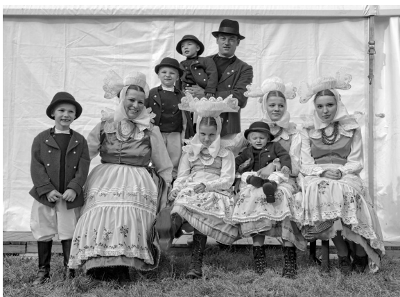
Ryc. 5. Rodzina w strojach biskupiańskich

okresie, gdy biskupiański folklor stanowił codzienność. Ponadto w Gminnym Centrum Kultury i Rekreacji w Krobi funkcjonuje kapela dudziarska, której celem jest nauka młodzieży gry na tradycyjnych instrumentach.