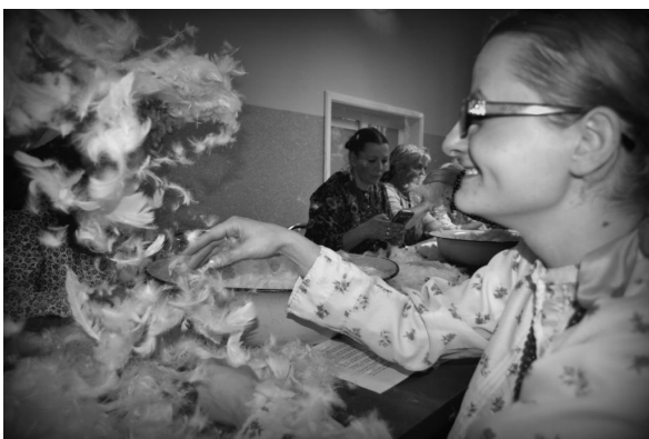
Ryc. 6. Darcie pierza w Domachowie

Swego rodzaju kulminację wszystkich działań stanowi organizowany co roku w Domachowie Festiwal Tradycji i Folkloru. Impreza ta, będąca jedną z większych z tego rodzaju w województwie wielkopolskim, cechuje się przede wszystkim tym, że przy organizacji jednoczy niemal wszystkie instytucje i organizacje pozarządowe funkcjonujące na terenie gminy Krobia. Miejscowe zespoły przygotowują inscenizację wybranego obrzędu, koła gospodyń zajmują się stroną kulinarną, jednostka Ochotniczej Straży Pożarnej odpowiada za zabezpieczenie imprezy i parkingi, pojawiają się bryczki, stoiska z rękodziełem, strefa zabaw dla najmłodszych, jest nawet towarzyszący