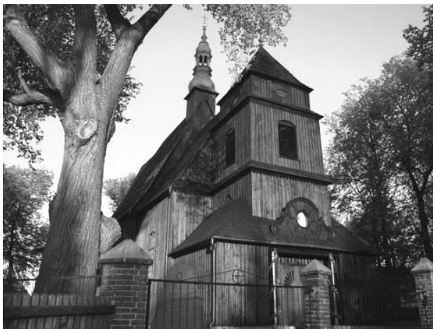
Ryc. 3. Drewniany kościół w Domachowie

Tereny Biskupizny znalazły się w granicach państwa pruskiego dopiero po drugim rozbiórce w 1793 roku. W 1794 roku pruskie władze skonfiskowały należący do biskupa poznańskiego klucz krobski. Biskupiznę wcielono do dóbr królewskich i zorganizowano w tzw. ekonomię krobską, którą oddano w dzierżawę. Ekonomia krobska obejmowała: zamek i miasto Krobię, wsie czynszowe i służebne: Żychlewo, Grabianowo, Posadowo, Rębowo i Bukownicę, wsie i folwarki: Krobia Stara, Sikorzyn