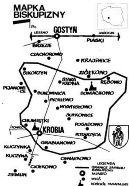
Ryc. 1. Zarys obszaru Biskupizny

Rozwijała się też sama Krobia, która stała się biskupią rezydencją. W latach 1438-1479 z inicjatywy biskupa Andrzeja z Bnina wzniesiono w Krobi murowany kościół parafialny pod wezwaniem św. Mikołaja. Poprzedni biskup, Stanisław Ciołek, na przełomie XIV i XV wieku wznosił poza murami miasta szpital oraz kościół szpitalny pod wezwaniem Świętego Ducha [Grupa, Miłkowski 2007]. W połowie XV wieku zbudowany został na miejscu starej kasztelanii zamek w stylu późnogotyckim, który pełnił funkcję rezydencji biskupów, poza tym był również obiektem obronnym oraz ośrodkiem administracyjnym całego klucza