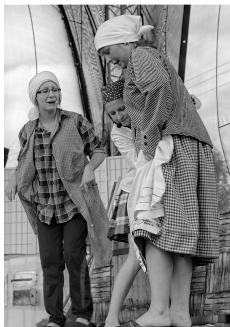
Ryc. 8. Grupa Teatralna „Na Fali”

Między innymi ze względu na organizowane imprezy władze gminy Krobia zdecydowały o zorganizowaniu w Domachowie Centrum Kultury Biskupiańskiej. W 2012 roku powstał Biskupiański Gościniec przy zabytkowym drewnianym kościele. W