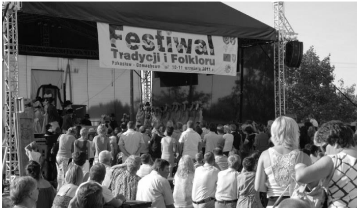
Ryc. 7. Festiwal Tradycji i Folkloru w Domachowie

imprezie co roku rajd rowerowy oraz zorganizowany w minionym roku po raz pierwszy półmaraton dla miłośników biegania. Na scenie zaś pojawiają się gwiazdy z kraju (np. Kapela ze Wsi Warszawa, Tęgie Chłopy), jak i zagranicy (Testamentum Terrae z Białorusi, Urmuli z Gruzji). Wszystko to sprawia, że do liczącej niecałe 500 mieszkańców wioski co roku zjeżdża około dwutysięczna publiczność.