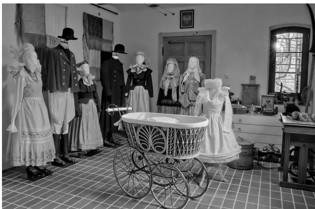
Ryc. 9. Izba biskupiańska w Muzeum Stolarstwa i Biskupizny w Krobi

Rozwojowi turystyki służą utworzone szlaki turystyczne. Powstał Biskupiański Szlak Turystyczny przebiegający przez wszystkie miejscowości Biskupizny. W każdej z nich stanęła tablica przedstawiająca pokrótce historię miejscowości oraz wskazująca najciekawsze miejsca. Utworzono też Biskupiański Szlak Kulinaryny, którego otwarcie miało miejsce na II Festiwalu Tradycji i Folkloru. Towarzyszyła temu publikacja w formie książki kucharskiej z tradycyjnymi potrawami biskupiańskiej kuchni. W projekt zaangażowały się wszystkie koła gospodyń, działające na Biskupiźnie oraz lokalni przedsiębiorcy promujący swoje produkty, wśród których należy wymienić kiełbasę biskupiańską oraz chleb biskupiański. Dzięki pobytowi w okolicach Krobi Adama Mickiewicza Biskupizna znalazła się również na szlaku mickiewiczowskim, co zaowocowało zaistnieniem w takich publikacjach jak „Wędrówki z Panem Tadeuszem” oraz „Kulinarne podróże z Panem Tadeuszem” Andrzeja Kuźmińskiego.